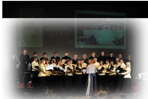
Autor: Igor Čepurkovski

- Međunarodno natjecanje zborova u folklornoj glazbi u Šibenik Dvije zlatne nagrade za dvije kategorije - strani i hrvatski folklor Nagrada za kreativnost u radu dirigentici Radmili Bocek