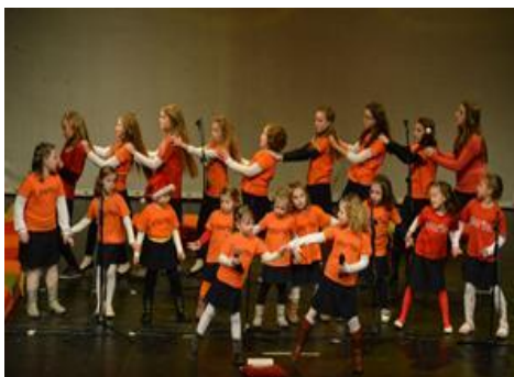
Autor: Igor Čepurkovski

- 24. Međunarodni dječji glazbeni festival "Mali Split" u Splitu Nagrada umjetničkog ravnatelja festivala Jovice Škare