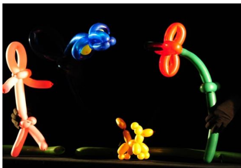
Autor: Igor Čepurkovski