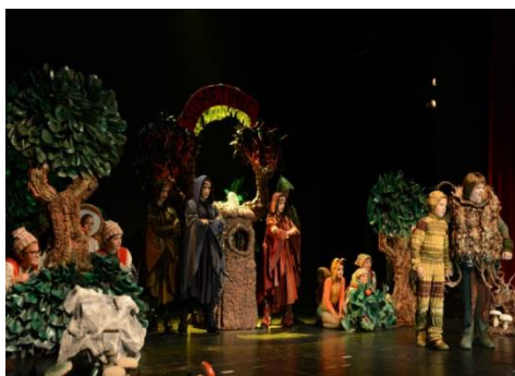
Autor: Igor Čepurkovski